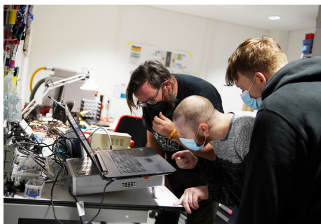
In einem Makerspace wird gemeinsam an kniffligen Herausforderungen gearbeitet.