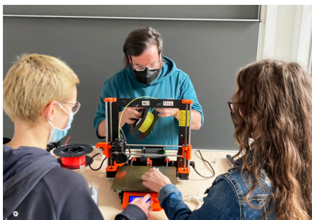
3D-Drucker finden sich häufig in Makerspaces, so auch in der Lichtwerkstatt.