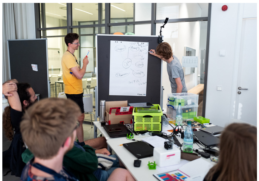
Die Entwicklung neuer Ideen erfolgt oft in kreativen Teams.

men der Optik- und Photonikindustrie mit der Gründerzene und mit Kreativen aus ganz anderen Bereichen. In den letzten Jahren hat sich gezeigt, dass ein Makerspace kein „Selbstläufer“ ist, sondern durch gut geplante und zielgruppengerechte Veranstaltungen bespielt werden muss. Das können zum Beispiel Hackathons, Innovationswettbewerbe oder Workshops sein. Die Lichtwerkstatt hat eine Reihe von Veranstaltungsformaten entwickelt, um Unternehmen und Institute der Photonik ganz gezielt mit einer aktiven Community aus Bastlern, Studierenden und Forschenden zu vernetzen. Durch diese neue Form der Zusammenarbeit können kreative